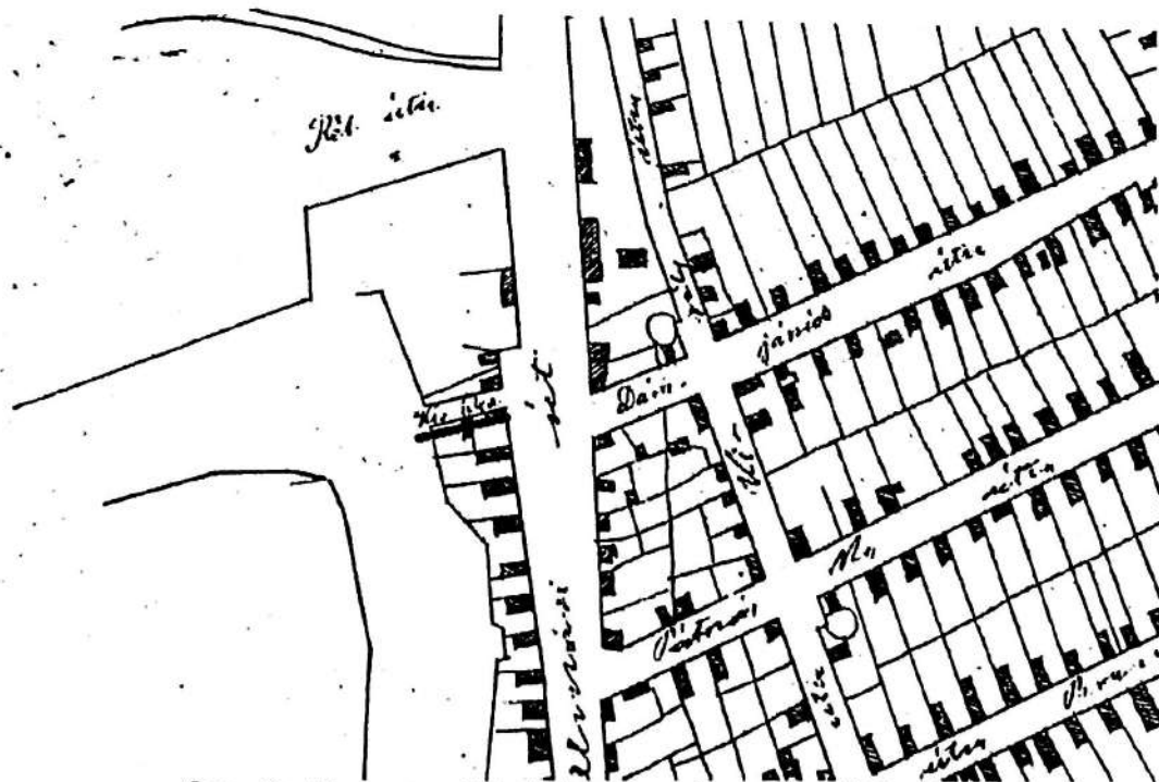
Слика 2 – Мала улица (Kis ulica) на плану Панчева из 1890. године ( https://улицепанчева.срб/мапа/архив-панчево-4-план-панчева )