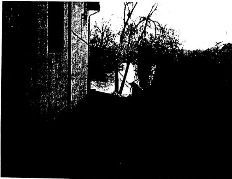
Слика 5 – пролаз