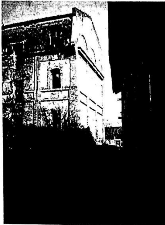
Слика 4 – пролаз ( https://улицепанчева.срб/фотографија/0494 )

Матични број: 28268564 ПИБ: 111167772 Текући рачун: 205-263097-86 (Комерцијална банка а.д. Београд)