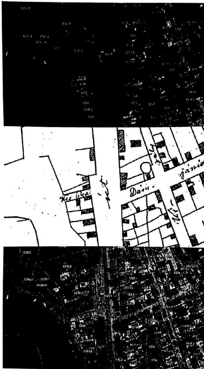
Слика 3 – приближно поређење старог и новог плана Панчева са фокусом на некадашњу Малу улицу

Матични број: 28268564 ПИБ: 111167772 Текући рачун: 205-263097-86 (Комерцијална банка а.д. Београд)